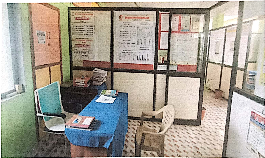
Department of Philosophy