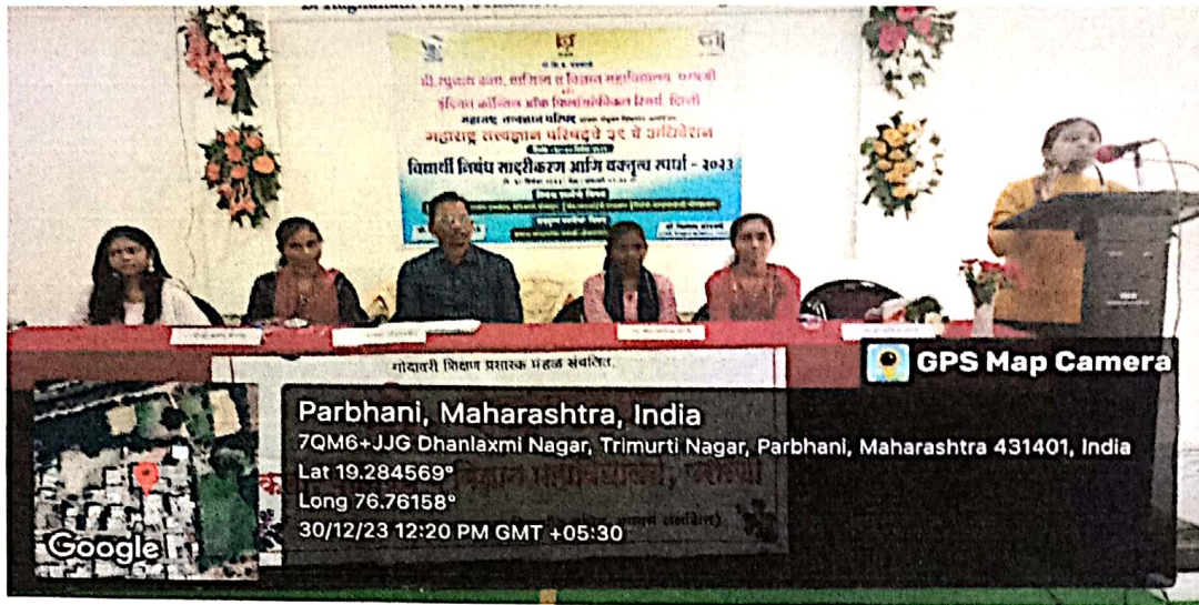
Worked as coordinator for presentation of Essay Competition organized by Maharashtra Tattvadyan Parishad